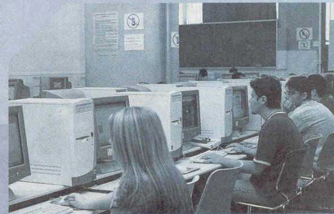
ΕΡΓΑΣΤΗΡΙΑ ΠΛΗΡΟΦΟΡΙΚΗΣ ΣΕ ΟΛΗ ΤΗΝ ΕΛΛΑΔΑ