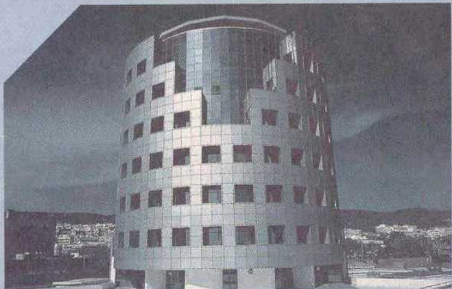
ΒΙΒΛΙΟΘΗΚΗ - ΑΡΙΣΤΟΤΕΛΕΙΟ ΠΑΝΕΠΙΣΤΗΜΙΟ ΘΕΣΣΑΛΟΝΙΚΗΣ

Η παιδεία μας άλλαξε υποδομές, άλλαξε φιλοσοφία. Η εκπαίδευση απέκτησε τις σωστές βάσεις. Το ΥΠ.Ε.Π.Θ. με τη συμβολή της Ευρωπαϊκής Ένωσης υλοποιεί το όραμα όλων για μια σύγχρονη, ευέλικτη, ευρωπαϊκή παιδεία. Μια παιδεία ανοικτή στην κοινωνία. Με ίσες ευκαιρίες για όλους. Έχουμε κάνει πολλά. Συνεχίζουμε με την ίδια δύναμη. Μαζί κοιτάμε μπροστά.